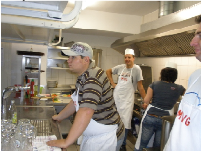
Die Jugend eroberte in der zweiten Schicht...