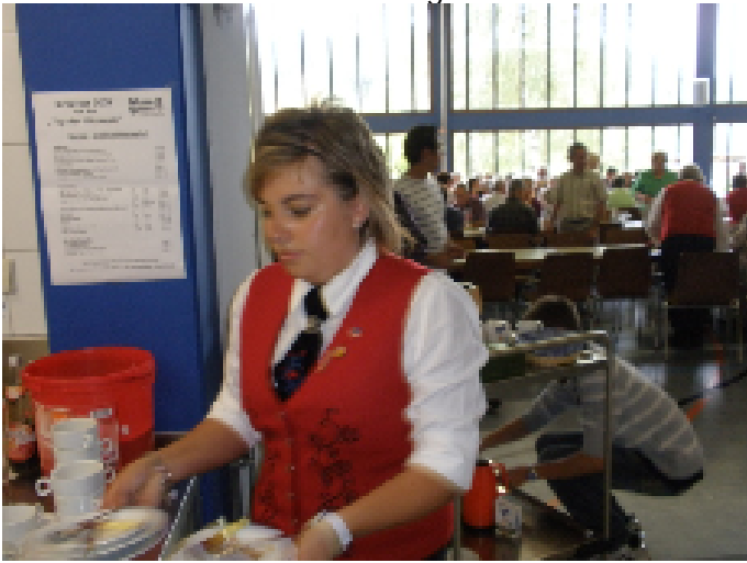
...mit denen der MV Grafenberg...