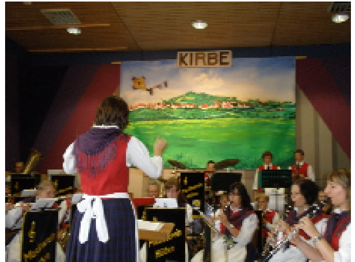
...von 14:00 – 16:30 Uhr aufs Vortrefflichste!!!