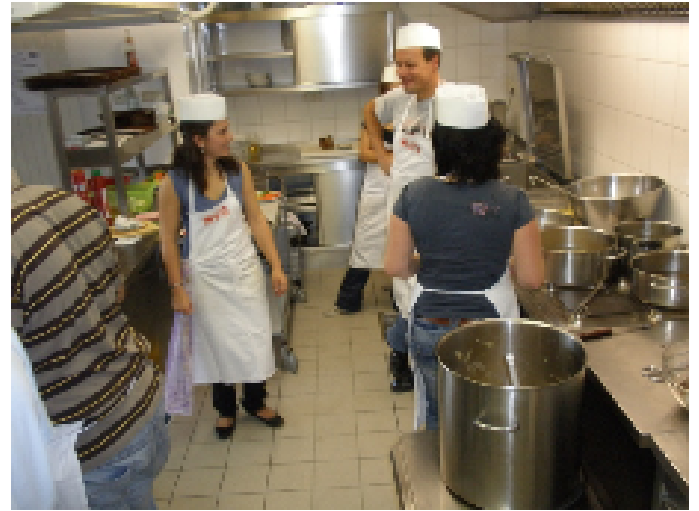
...die Küche. Bravo, weiter so!