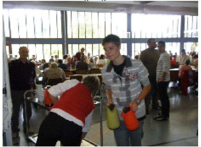
...zum Glück reichlich gesegnet ist!