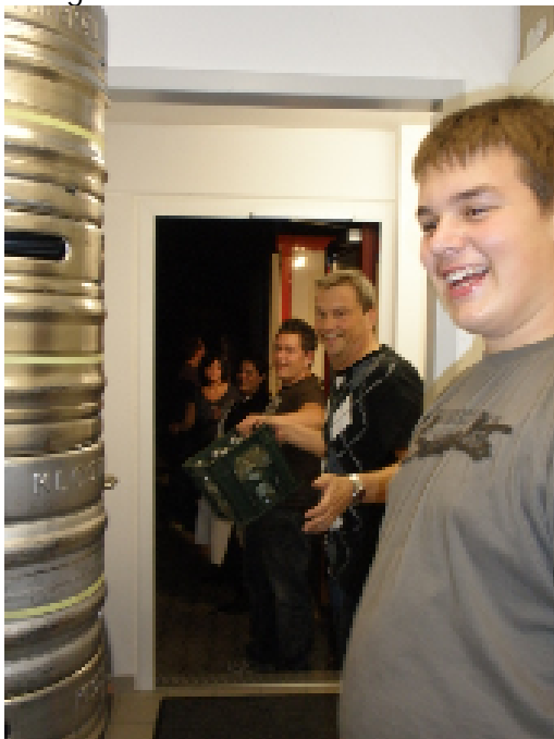
Lustige Kette zum Laden des Getränke-Anhängers.