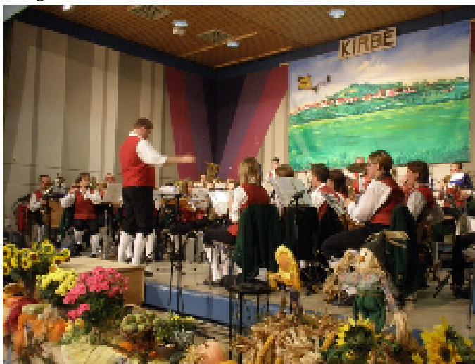
Ein guter Schluss ziert alles: die Aktiven...