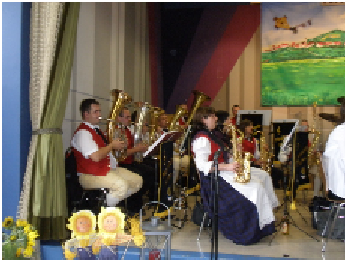
...unsere Gäste in der Rienzbühlhalle...